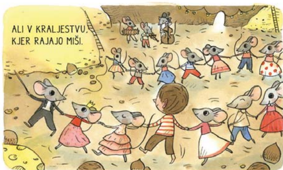
NAPISAL HA SCRITTO: FERI LAINŠČEK (IZSEK), CICIDO ŠT. 8, 2019

giustapposizione di immagini consecutive. La rielaborazione dei testi letterari in fumetti spesso mantiene solo i dialoghi, riducendo il testo al minimo, mentre il disegno racconta quello che è descritto in prosa o in verso. In tal modo, i fumetti esaltano il materiale letterario poiché le immagini e le parole interagiscono tra loro in un modo nel quale non potrebbero farlo individualmente. I fumetti non hanno necessariamente bisogno di balloon veri e propri, e così Maja Kastelic non li usa nemmeno, anche se sono una parte riconoscibile della forma del fumetto. Allo stesso tempo, i dialoghi usati vengono elaborati visualmente e fanno parte dell'immagine - non sono necessariamente posizionati soltanto sul bordo dell'immagine o sotto di essa, come era tipico dei primi fumetti in generale.